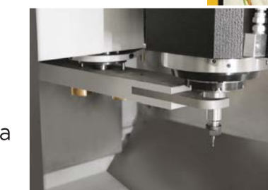
Braccio di scambio