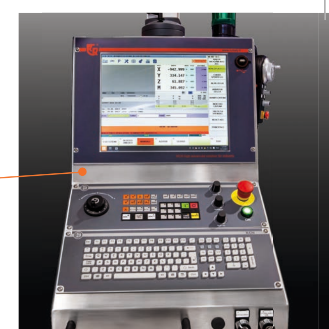
CNC Z32 - D. Electron

SGROSSATURA E FINITURA IN UN'UNICA MACCHINA