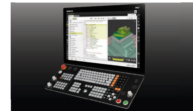
CNC TNC7 - Heidenhain